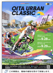
大会公式ポスター