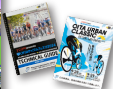
テクニカルガイドブック(左) 公式ガイドブック(右)