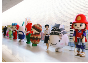
全国都市問題会議(アクリエひめじ)

弊社は十分に本社を構えています。遠隔地での案件もスムーズに進めるノウハウとネットワークがあることが強みの一つ。コスト管理の観点から現地に足を運ぶのを必要最低限にしつつも、クライアント様がご不安にならないよう、メールや電話、オンラインでの打合せなどを密にすることを大切にしています。また地方でのMICE開催の意義でもある地元の経済波及効果のために、印刷や会場設営、スタッフ派遣などは開催地の業者への発注を心がけています。