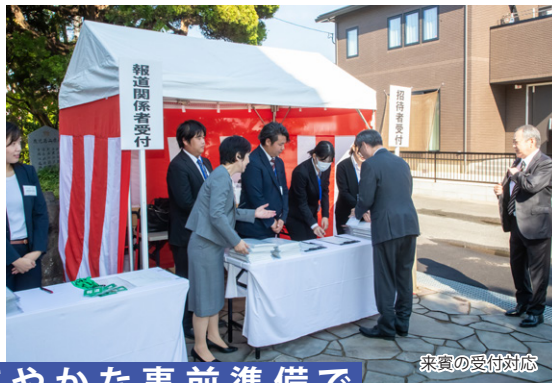
こまやかな事前準備で 記念式典をスマートに進行